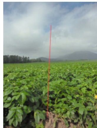
遠くからでも確認しやすい ダンポール赤色タイプ（用途例）